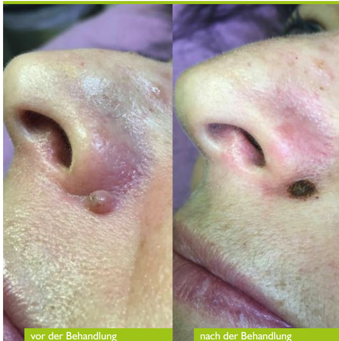
7 Tage Abheilungsprozess

PLASMAGE® nutzt die Ionisierung der uns umgebenden Luft (speziell Sauerstoff u. Stickstoff). Das entstehende Plasma sublimiert die obersten Hautschichten, ohne die Dermis zu schädigen. Gleichzeitig werden vorhandenen Keime abgetötet und somit eine schnelle Heilung ohne Narbenbildung oder Infektionen ermöglicht.